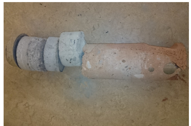
Bohrkern Ziegeldecke mit Aufbeton, Estrich und Belag