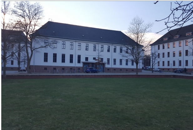
Ansicht Haus 18